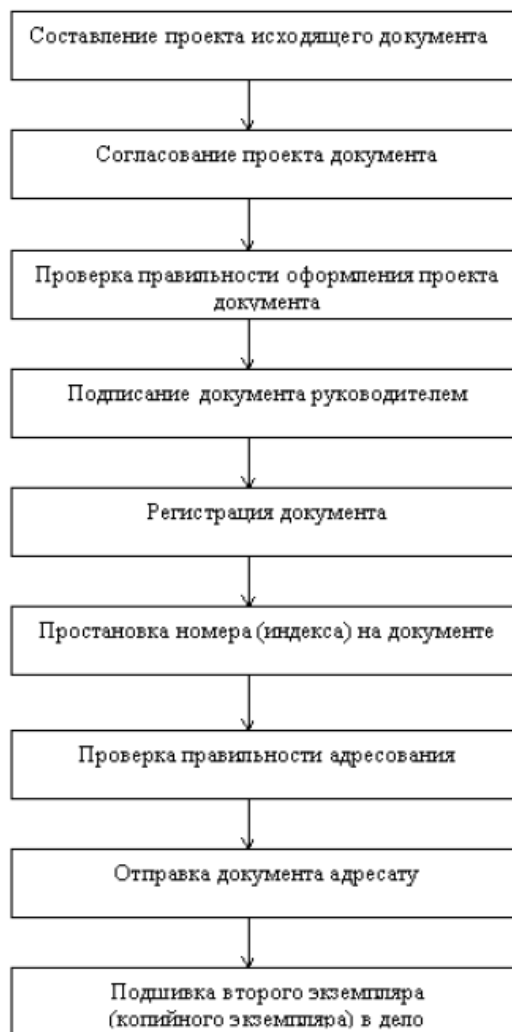
Слайд № ____ - Схема обработки исходящих документов

Схема обработки исходящих документов представлена на (Слайде № ____).